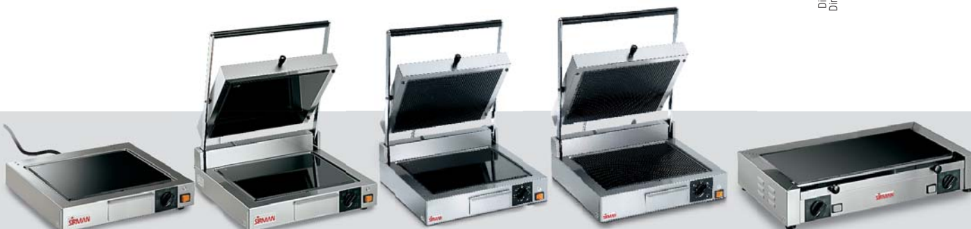
CORT TOP V. L