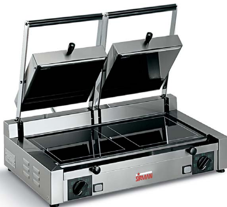
PD V LL