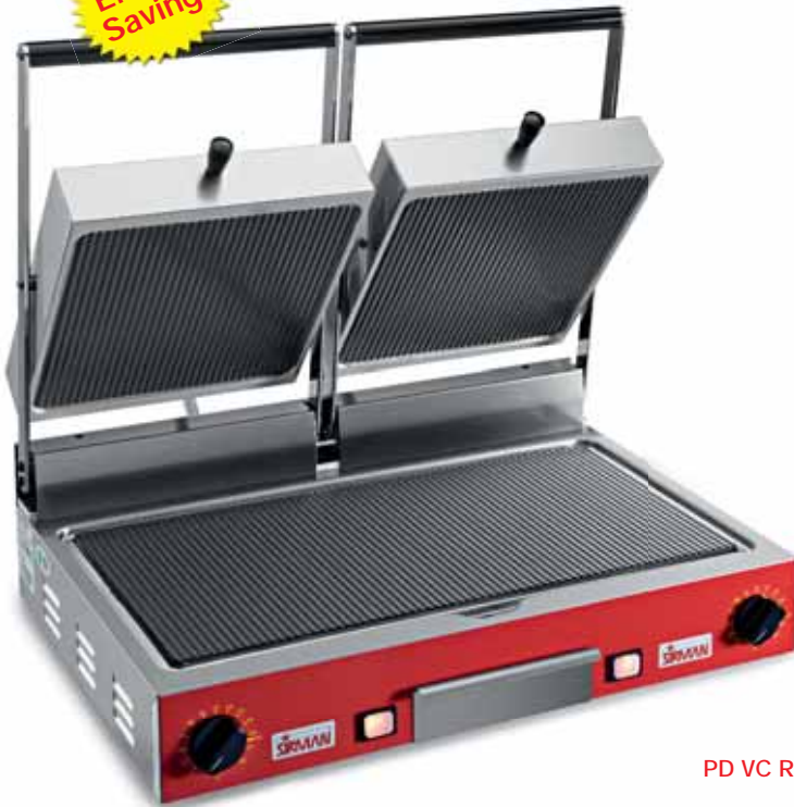
PD VC RR