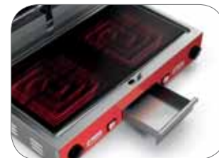
1. Cassetto raccolta liquidi e residui di cottura Useful drip tray for liquids and other cooking leavings