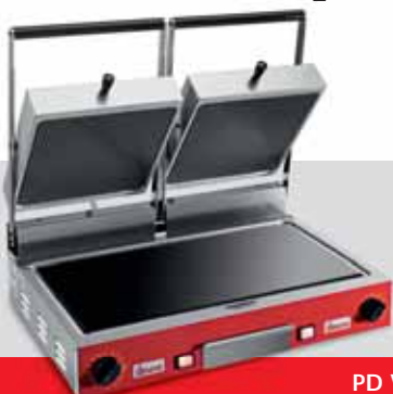
PD VC LR