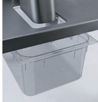
Table sur roulettes en acier inoxydable pour machines Tavolo in acciaio inossidabile su rotelle Stainless steel machine table on castors