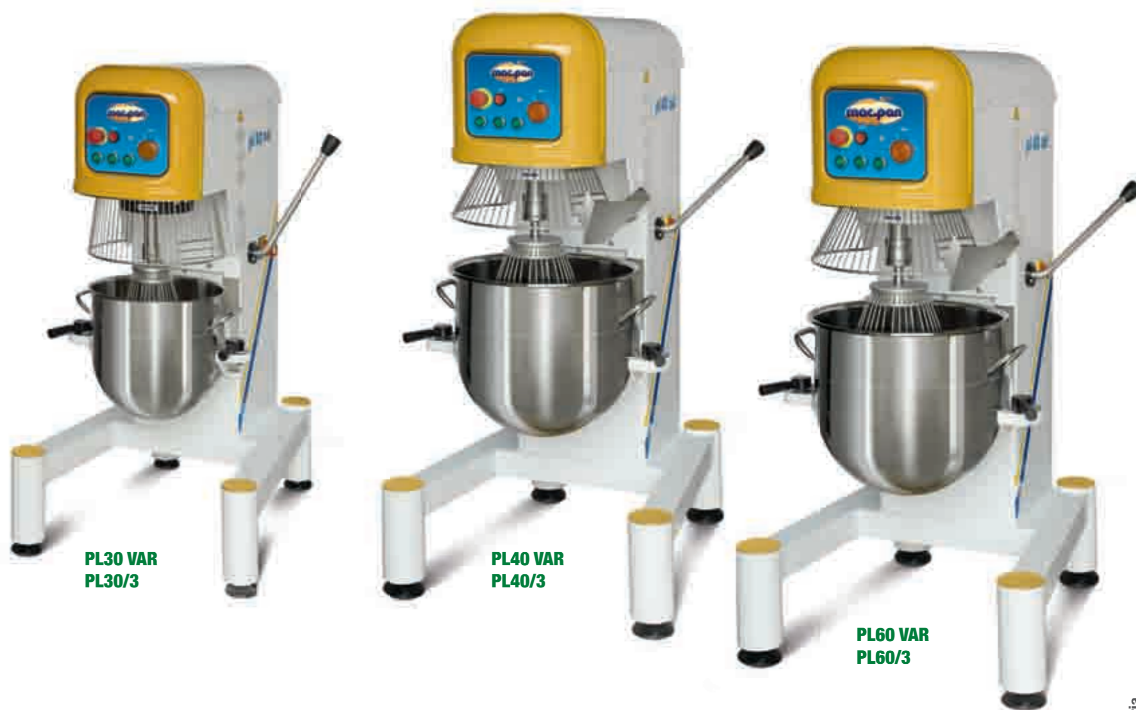
PL30 VAR PL30/3

ESP Es una máquina apta para medianas y grandes pastelerías y heladerías. Construida integralmente en acero estampado de largo espesor, es una máquina robusta, silenciosa y de larga duración. El cambio de velocidad se hace gradualmente por medio de un variador electrónico que se acciona con la máquina en funcionamiento mediante un volante colocado al lado de la máquina. La transmisión con correa la vuelve la más silenciosa de la categoría. La tina en acero inoxidable es regulable en altura manualmente mediante un volante colocado al lado de la máquina. Viene equipada con cuatro accesorios (azote de hilos finos, azote de hilos gruesos, gancho y espátula) en acero inoxidable según normas legales vigentes. La serie viene construida con mandos eléctricos de baja tensión y sistemas según normas legales vigentes.