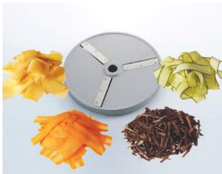
Hobelschnitt (HS) • Coupe ultrafine (HS) • Affettaverdura (HS) • Shaving cut (HS)