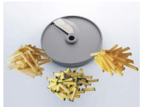
Bâtonnets (BT) • Bastoncini (BT) • French fries (BT)