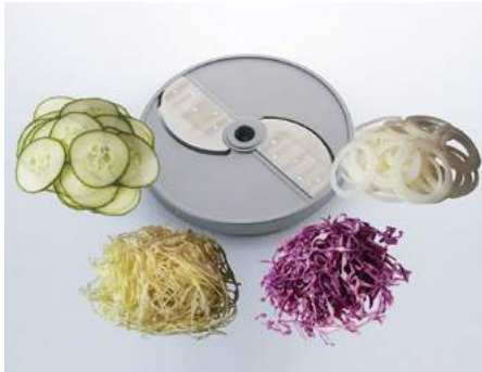
Feinschnitt (F) • Tranches fines (F) • Taglio fine (F) • Fine cut (F)

Élément de râpage / Assortiment • Inserto per grattugiare / Assortimento • Grater insert / Assortment