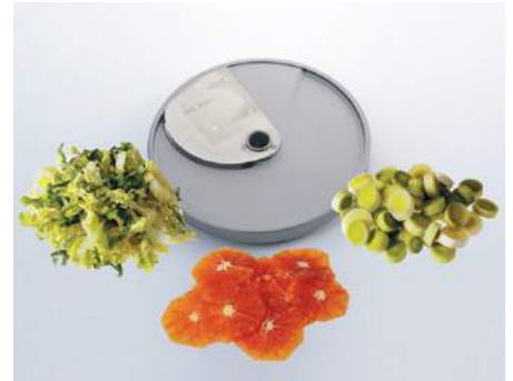
Tomatenschnitt (TO) • Coupe tomates (TO) • Taglio pomodori (TO) • Tomato slicer (TO)

G3 3 mm G6 6 mm G10 10 mm G4 4 mm G8 8 mm G12 12 mm G16 16 mm