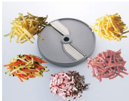
Allumettes (PA) • Fiammiferi (PA)