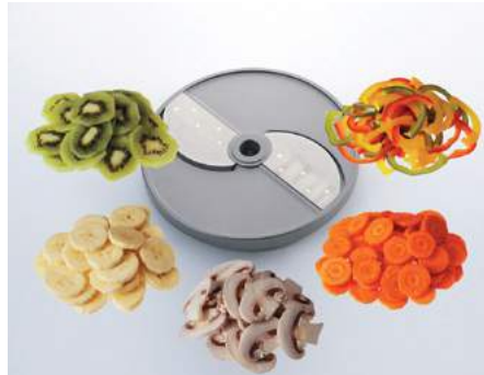
Grobschnitt (G) • Tranches épaisses (G) • Taglio grosso (G) • Coarse cut (G)

G3 3 mm G6 6 mm G10 10 mm G4 4 mm G8 8 mm G12 12 mm G16 16 mm