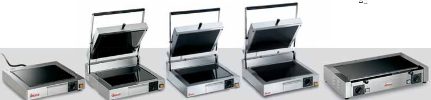
CORT TOP V. L