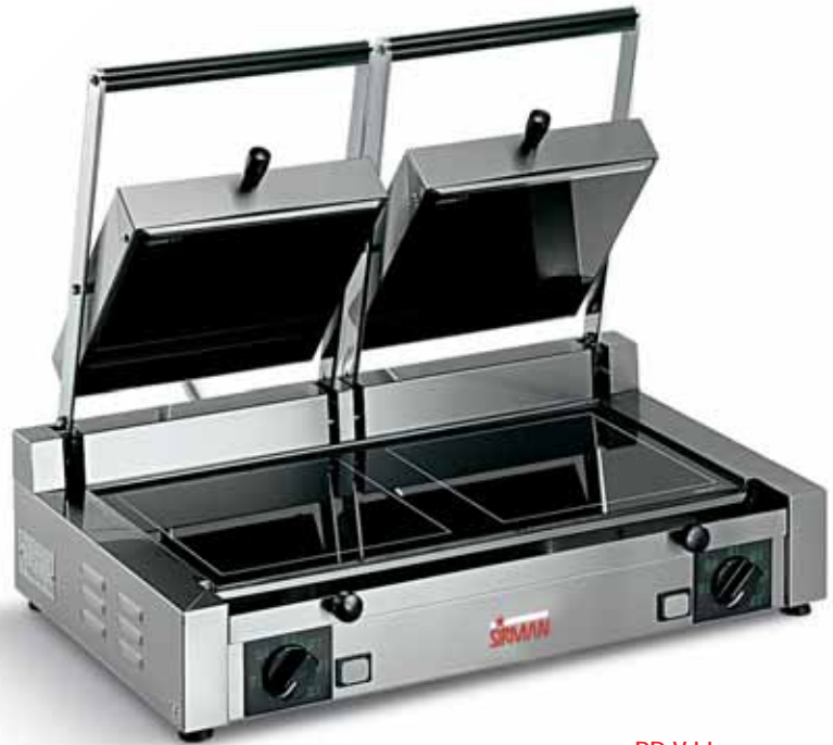
PD V LL