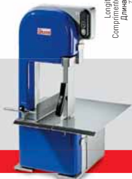
SO BREMEN BASIC