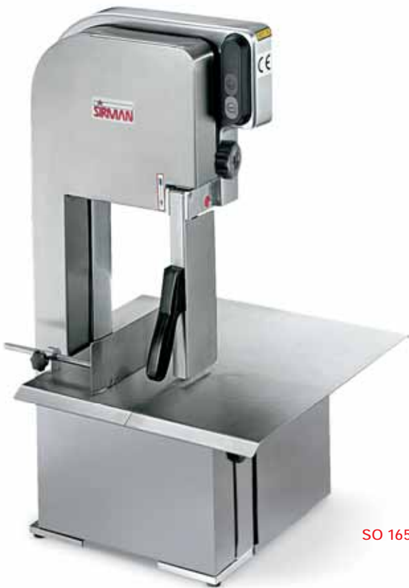
SO 1650 BREMEN