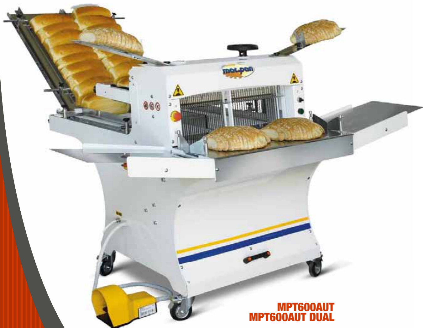
MPT600AUT MPT600AUT DUAL