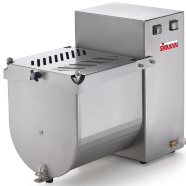
Sirman Фаршемешалки , model IP 10 M :

Sirman Spa Viale dell'Industria 9/11 35010 PIEVE DI CURTAROLO (PD), Italy Tel./Fax. +39 049 9698666 / +39 049 9698688 email: info@sirman.com