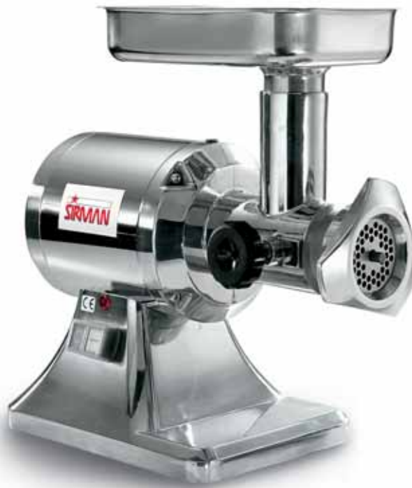
TC 12E - 22E