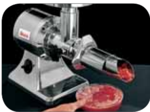
2. Passapomodoro per TC/TCG 22E Tomato sauce making for TC/TCG 22E