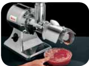
1. Passapomodoro per TC/TCG 12E Tomato sauce making for TC/TCG 12E