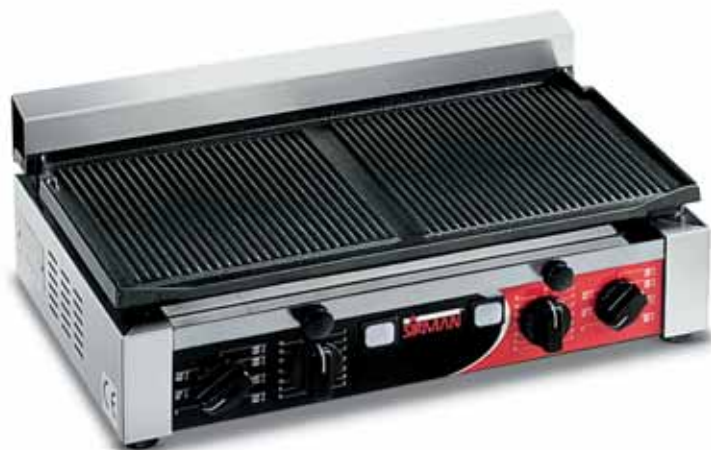
TOP R TIMER