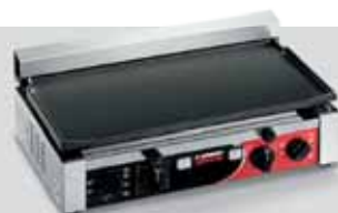
TOP L TIMER