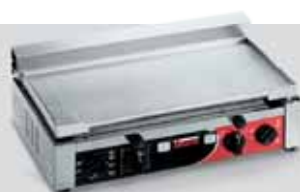
TOP X TIMER