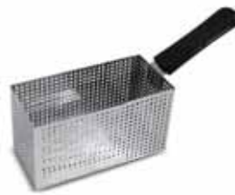
1. Cestello maxi: di serie per Pasti 10 / opzionale per Pasti 8 Maxi basket: standard for Pasti 10 / optional for Pasti 8