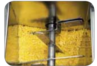
2. Impasto Dough