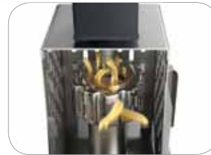
1. Tagliapasta opzionale Optional pasta cutter