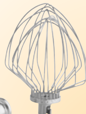
FRUSTA K7P WHIP K7P