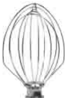
FRUSTA K5 WHIP K5