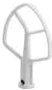
SPATOLA K5 SPATULA K5