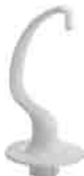
UNCINO K5 HOOK K5