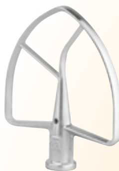
SPATOLA K7P SPATULA K7P