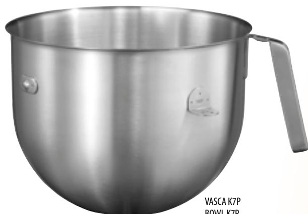
VASCA K7P BOWL K7P