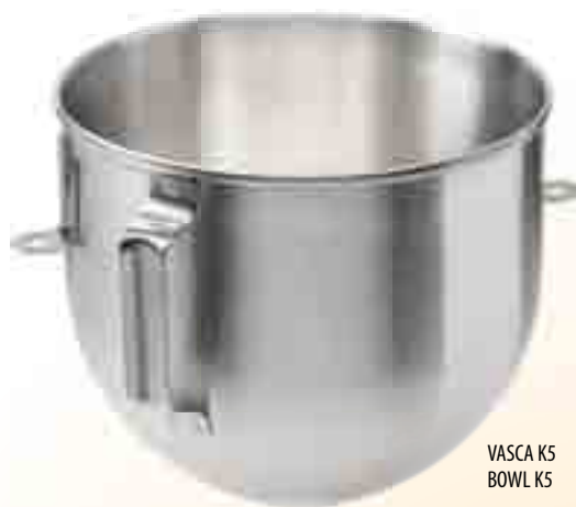
VASCA K5 BOWL K5