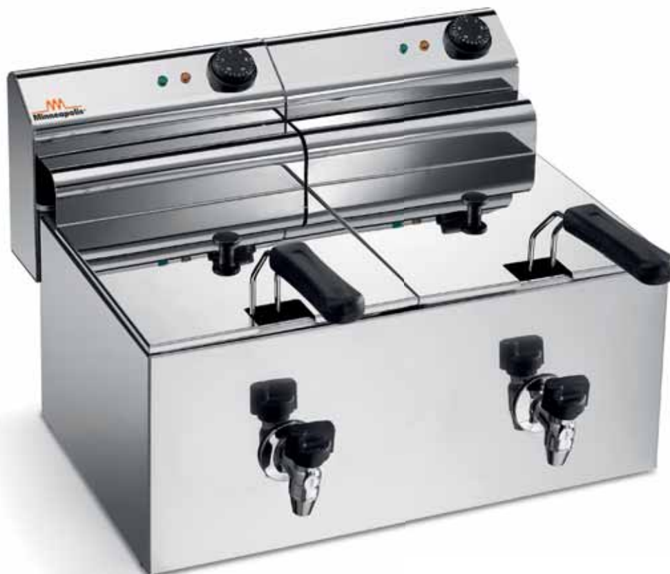
ELDORADO 8X2 R