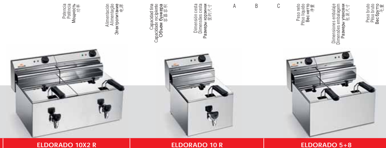
ELDORADO 10X2 R