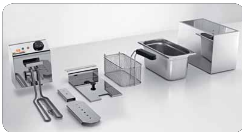
5. Facile da smontare e pulire Easy to disassemble and clean