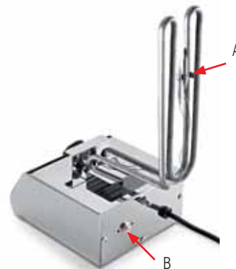
4. (A) Bulbo termostato (B) Pulsante di ripristino cut-off (A) Thermostat bulb (B) Cut-off reset button