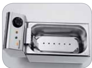
1. Protezione antiurto resistenze Shockproof protection for resistances