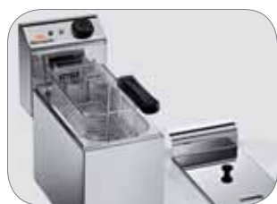
2. Posizione di sgocciolo Position of drip