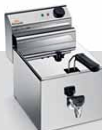
ELDORADO 8 R