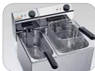
3. Pratico cestello da maneggiare Easy to handle basket