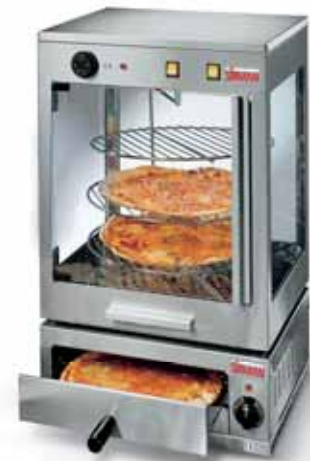
1. Impilabile con la Vetrinetta D. 38 Stacking with Vetrinetta D. 38