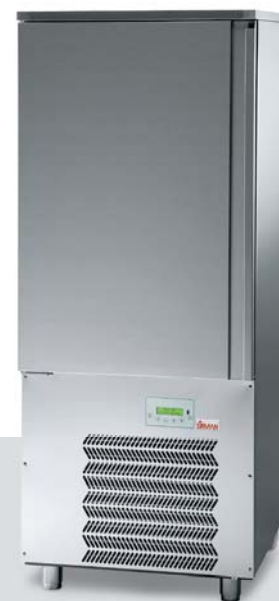
CERVINO GASTRO 1/1 e PASTICCERIA 600x400