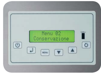
3. Cervino gelateria: Pulsantiera elettronica Cervino gelateria: Electronic push-button