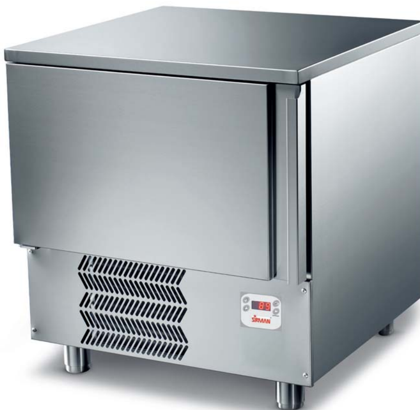
CERVINO 5 Y08