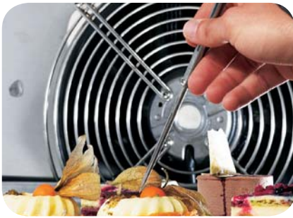
1. Sonda rilevamento temperatura nel cuore del prodotto. Probe to survey the core temperature of the product.