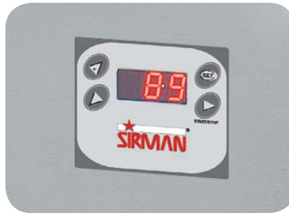
2. Lampo Y08 / Cervino 5 Y08: Pulsantiera elettronica Lampo Y08 / Cervino 5 Y08: Electronic push-button