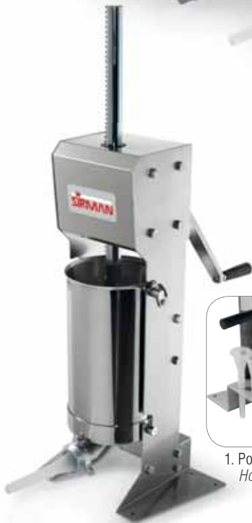
IS 12 VX