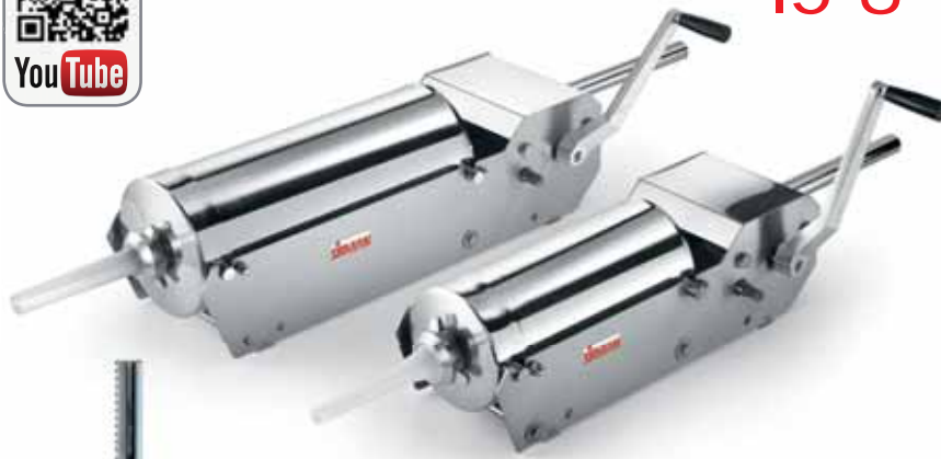
IS 8-16 X