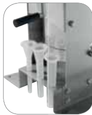
1. Porta imbusti Holder funnels