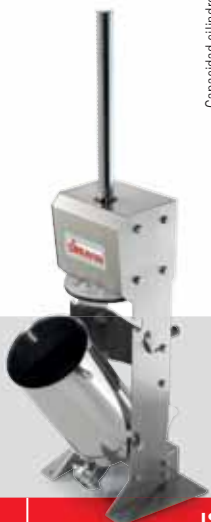
IS 12 VX