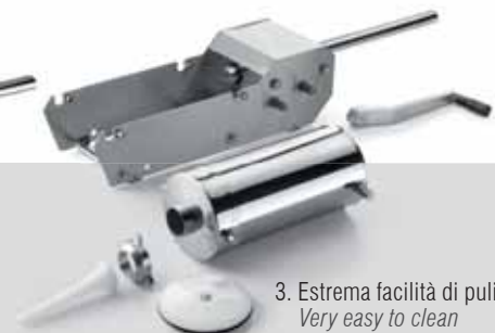
IS 8-16 X