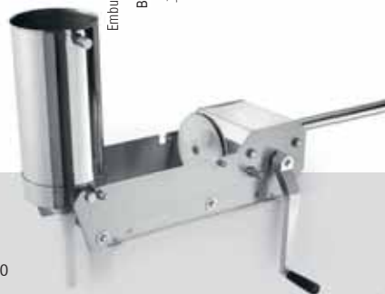
IS 8-16 X