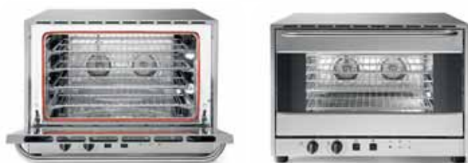
1. n.4 griglie di serie facilmente rimovibili e doppia ventilazione n.4 removable racks standard and double ventilation