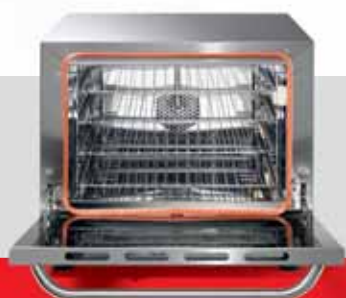
2. n.4 griglie di serie facilmente rimovibili e ventilazione singola n.4 removable racks standard and single ventilation